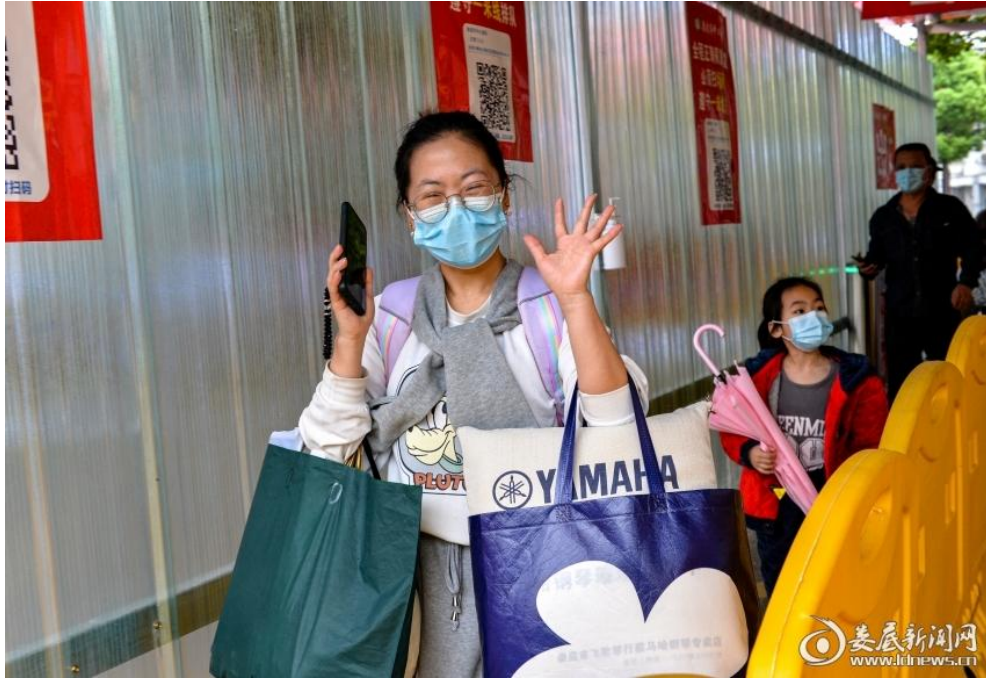
△4月10日，娄底市中心医院住院部患者及家属走出医院，走进阳光里，回归正常生活。