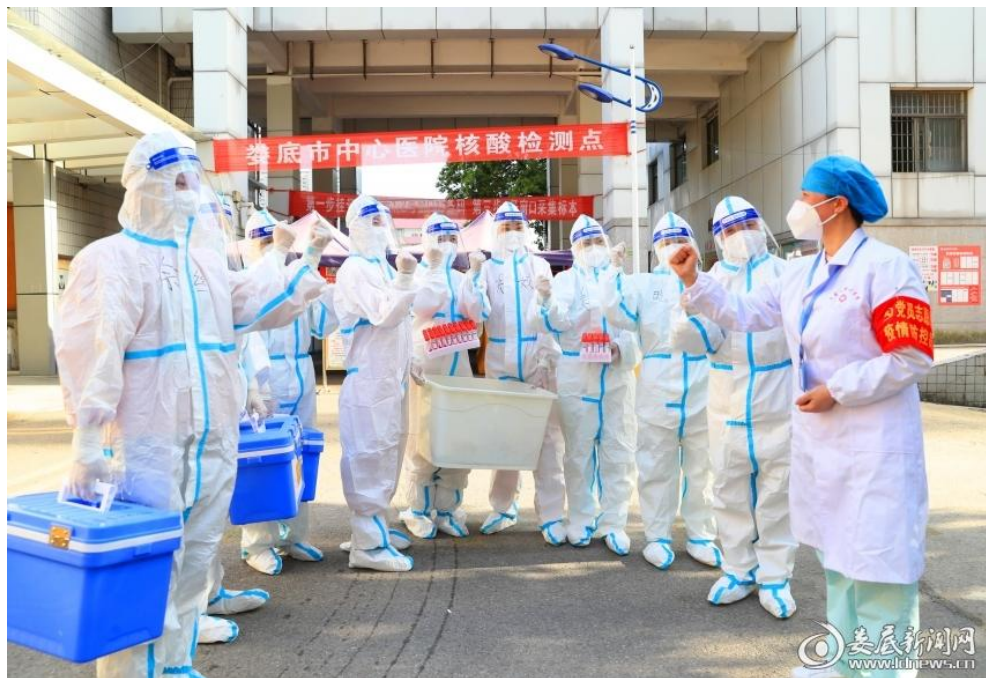
△“大白”们争分夺秒、夜以继日进行核酸采集、检测工作。